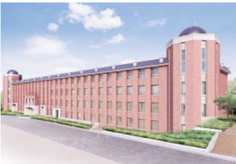
以文館並びに以文館学術フロア(シアタースペース)仮称 (平成十八年三月増築完成予想図)

平成十七年度消費収支予算は、消費収支予算書の含め、四百二十八億八千八百円とありますが、これを総括したものが表2です。消費収入は、学生生徒等納付金、手数料、補助金など