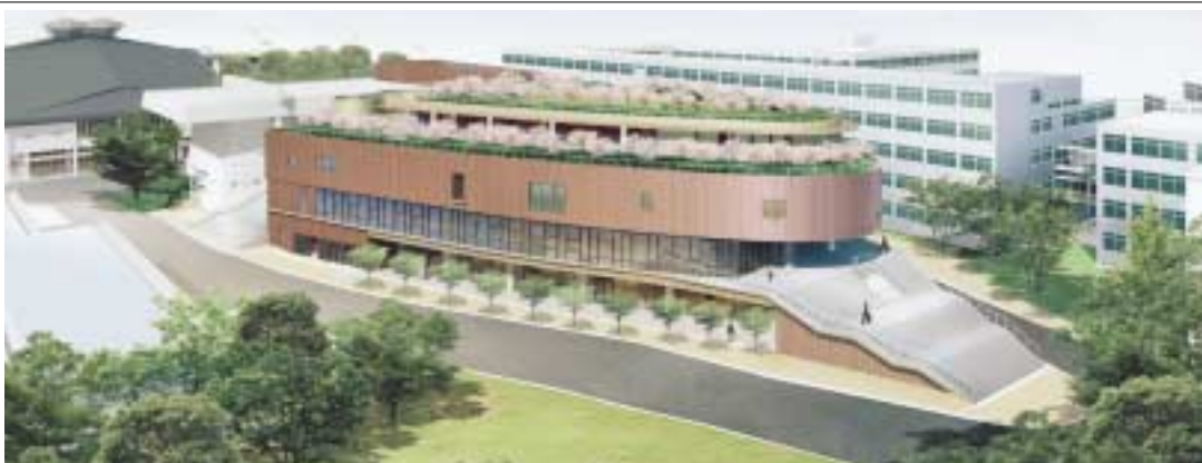
総合学生会館 メディアパーク 凧風館(平成18年2月竣工予想図)