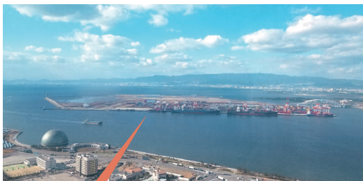
咲洲庁舎から夢洲を望む▶ (2019年1月撮影)

ワシントン州に先住民のカジノがあり、米国滞在中に知り合った研究者に「カジノの会計上の問題に興味がある。日本にできるカジノと一緒に研究しよう」と誘われたのがきっかけです。文部科学省の科学研究費プロジェクトに採択され、2020年4月から研究を始めました。ゲーミング(賭博)は現金取引が多くガバナンスも複雑で、現在、ようやく国内の類似業種、パチンコや競馬の問題点の整理ができたところです。今年8月に渡米の計画があり、大阪でIRの実現を目指しているMGMリゾート・インターナショナル社(米国)にネバダ州現地調査への協力をお願いしています。