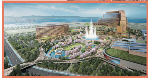
◀大阪IRのイメージ写真 (※RFP提案時点でのイメージであり、今後変更となる可能性があります)