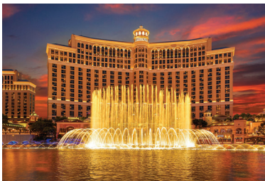
MGMリゾートが運営する ラスベガスのペラージオホテル▶

米国の企業はしっかりした収益基盤と独立したガバナンス体制を備えており、また規制当局も監視しています。日本では、事業者の収益性が確保されるのかどうか分かりません。また、国内にはすでにゲーミング関連事業が相当なマーケット規模を有しているのに、IRだけを別枠で考えるのはすごく奇異に感じます。縦割行政の現われでしょう。経済振興という究極的な目的のために、ゲーミング関連事業を育成していこうという気構えがあまり感じられません。国と地方公共団体との言い分を押しつけて「果たしてうまくいくのかしら」と思います。日本のIRはちょうど官と民の接点ともいえる位置付けにあり、事業を成功に導くためのガバナンスの課題を洗い出したいと思っています。