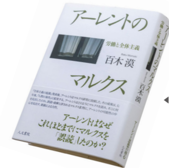
◀アレントの思想を「労働」と「マルクス」の視点から読み解いた著作 Momoki's book elucidating Arendt's thought from the perspectives of labor and Marx

labor/Arbeiten work/Herstellen action/Handeln