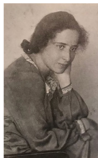
ハンナ・アーレント Hannah Arendt