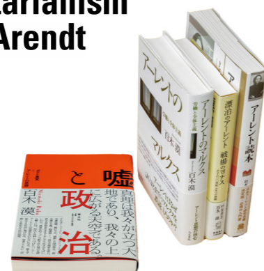
百木漢准教授の著書▶