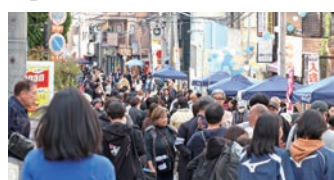
▲多くの人で賑わった関大前通り

11月15日、地域と大学が協働する新たなイベント「関大前まつり」が関大前通りで開催された。関大前商店会実行委員会主催、吹田市後援による本イベントは、地域活性化と地域防災・福祉の機運向上が目的。当日は屋台や縁日、関大生によるショーが行われ、一部歩行者天国となった関大前通りは家族連れなどで大いに賑わった。また、防災の実証実験のほか、認知症の方や子供の搜索を支援する「みまもりあいアプリ」の使用試験なども実施された。