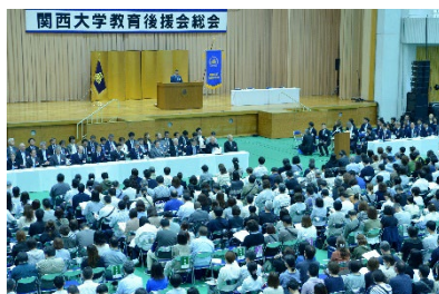
■ 全国から大勢の父母が集まる