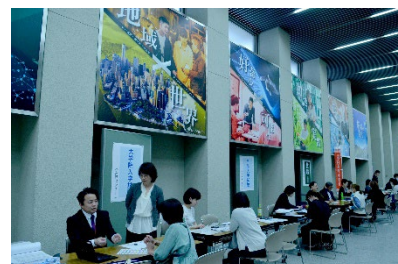
■ 個別相談コーナーの様子

2025年度の総会では全国各地から約5,000人を超える参加があり、2026年度はさらなる参加が見込まれています。年間を通しての父母の会の参加者数は、朝日新聞出版発行『大学ランキング』に過去掲載された調査において、常に全国1位の実績を誇りました。参加した父母からは、子どもの学生生活の様子を知るだけでなく、自らもキャンパスライフを体験できる「父母の一日大学」として、好評を博しています。