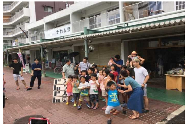
だんだんテラスと子どもたち