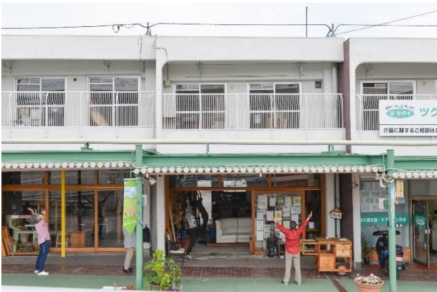
毎朝のラジオ体操