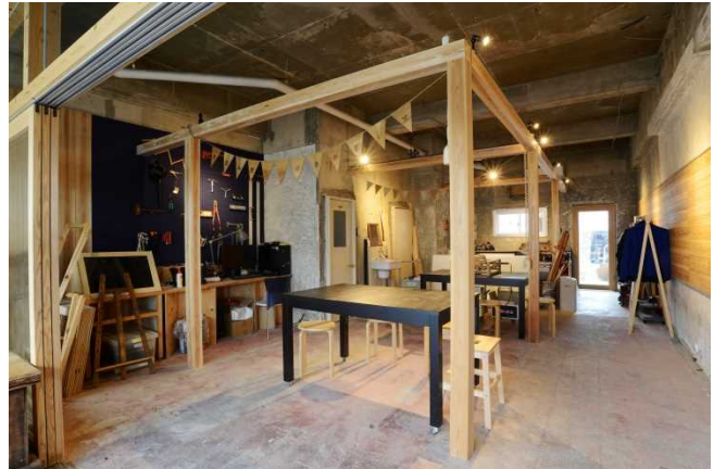
だんだんラボ（DIYサポート）