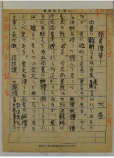
石濱原稿「読書随筆」 (総合図書館蔵)