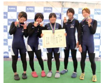
初のメダルを獲得した関西大学体育会漕艇部女子

関西大学体育会漕艇部女子が、5月3日から6日、滋賀県大森湖漕艇場で開催された第67回朝日レガッタの一般女子舵手つきクォドルブルで、見事準優勝に輝いた。予選、準決勝ともに攻撃的に漕ぎ進め、首位で通過。決勝戦では東北大が抜け出すも、2位争いでデンソーとのデッドヒートを繰り広げ、わずか0秒15の差で銀メダルを奪取した。創部91年目にして女子では初のメダル獲得。快挙達成にクルー5人は喜びを爆発させ、更なる躍進を誓い合った。