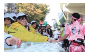
▲給水ボランティア

大阪府・大阪市などが主催する第4回大阪マラソンが10月26日(日)に開催される。