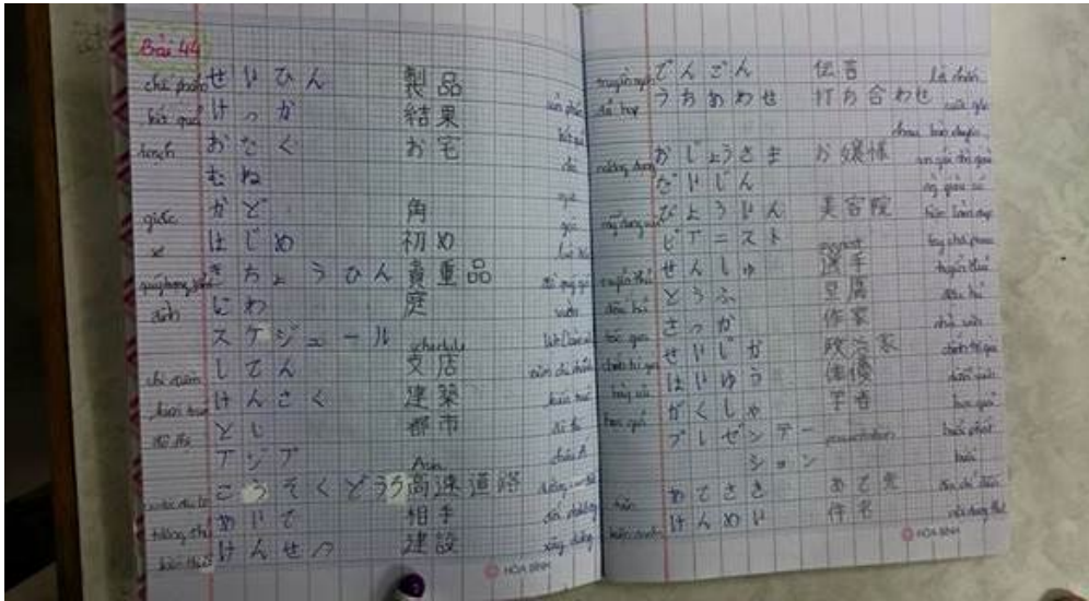
写真：一般的なベトナムのノート使用例