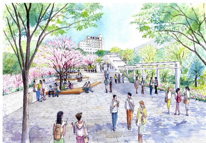
<完成イメージパース>

現在、「関大前」駅から千里山キャンパスへのアクセスは、駅北口から正門に通じる通り（通称：関大前通り）と、駅南口から南門（エスカレーター）を利用する2つのルートがあります。同キャンパスには