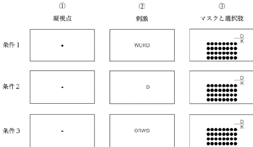
図1 提示刺激及び実験条件の例