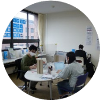
エレベーターホール左側