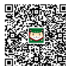
【オンライン相談方法】