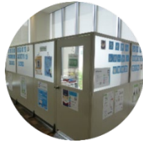
西館2階 ミューズカフェ