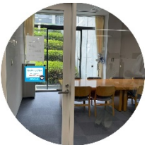
高槻キャンパス図書館 グループ閲覧室