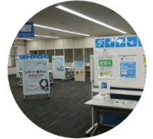
ラーニング・commons内 ライティング・エリア