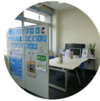
A棟3階 ラーニング・commons