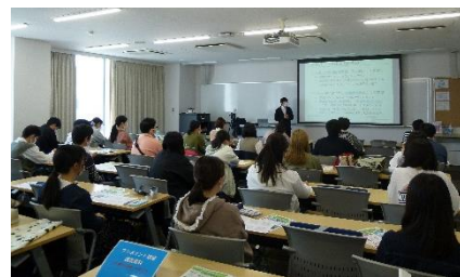
(春学期ワンポイント講座の様子)