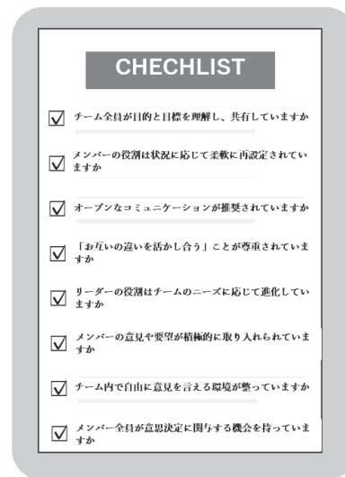
図5 チェックリストの例

グループワークを進めるうえで、さらには課題達成を目指すうえで、不可欠になると考えられる項目を複数列挙し、その日の作業において、そのことに対する意識や留意があったかどうかをチェックするためのリストである(図5)。リストに掲げる項目はグループワークの進捗に応じて新しいものに替えていくのがよい。また、グループワークの経験値が高まってきたら、項目を学生に決めてもらうと、自らの活動に対する意識が高まるという効果がある。