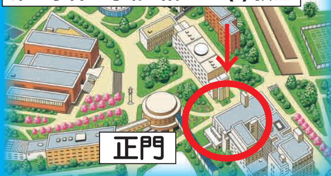
第3学舎1号館4階A401(B)教室

今回は実際に先生方にパソコンを 操作して頂くため、パソコン教室 での実施になります。