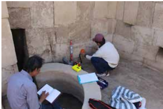
岩石劣化診断調査 Survey of Rock Quality

stone deterioration diagnosis using newly obtained equipment such as Schmidt Hammer and Equotip Hardness Tester, we also acquired detailed data of the surveyed target area by aerial photography with the 3D laser scanner, drone, and comparative research with photographs taken at the excavation sites. Consequently we got detailed information on the priority target area by acquiring image data used for the target area.