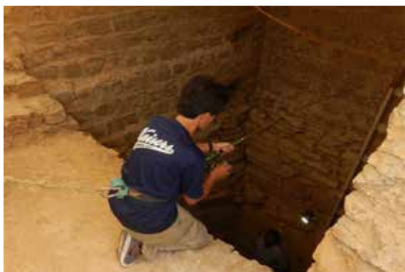
シャフトの3Dデータを取得する様子 Aquisition of 3D Data

The second survey in November 2017 was conducted before and after the International Meeting held in Saqqara. Since we were finally granted the security clearance at the end of October, we were able to proceed research inside the burial chamber of Mastaba Idout. In the survey, we acquired 3D measurements of the shaft which leads to the burial chamber. 3D measurements of the shaft have been taken several times before,