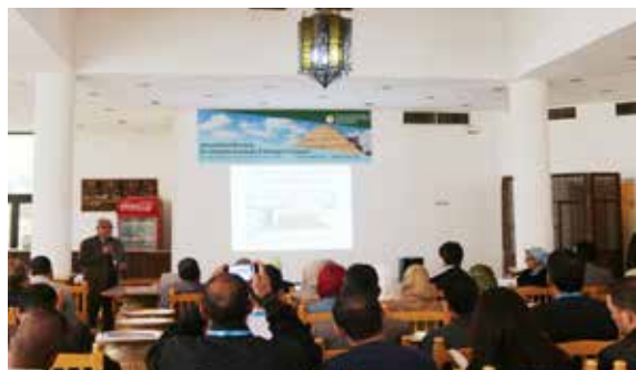
会議の様子 Lecture Session in the Meeting

This meeting aimed to share with local experts the activities and research achievements of Kansai University’s 10 years mission which was mainly implemented under the Institute for Conservation