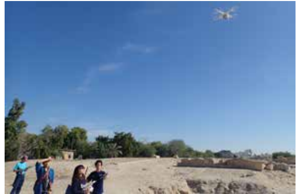
ドローンによる遺跡の記録調査 Documentation Using the Drone