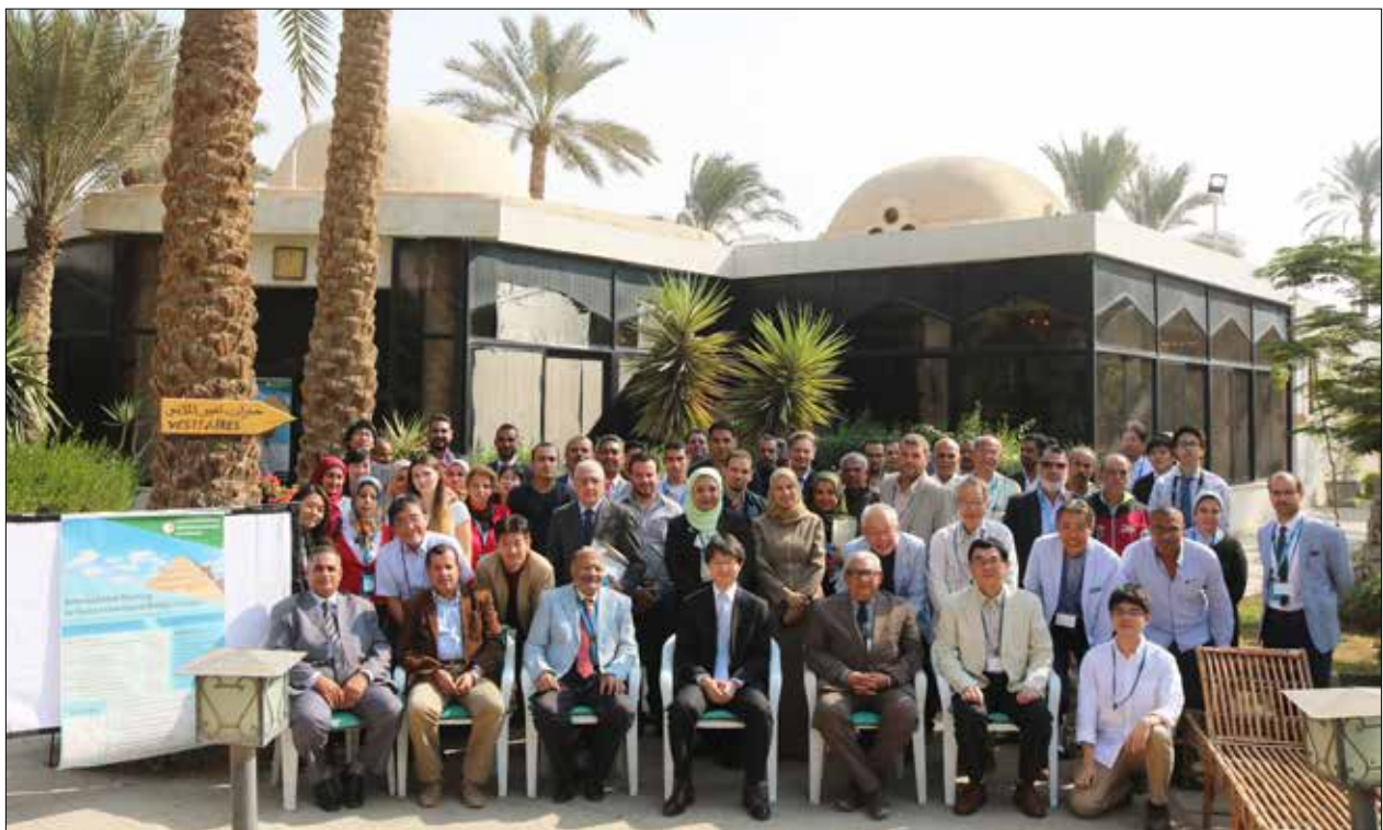
会議参加者との集合写真（サッカラ・パームクラブにて） Group Photo with Participants of the Meeting at Saqqara Palm Club