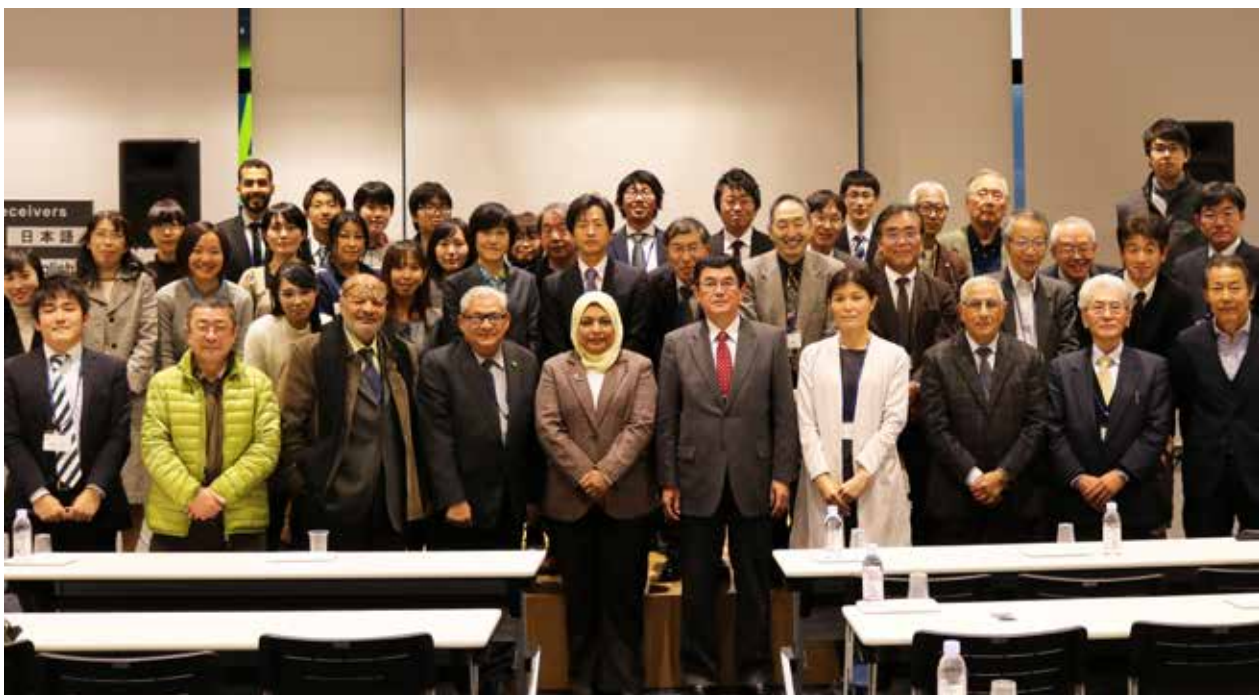
報告会参加者との集合写真 Group Photo with Participants of the Conference