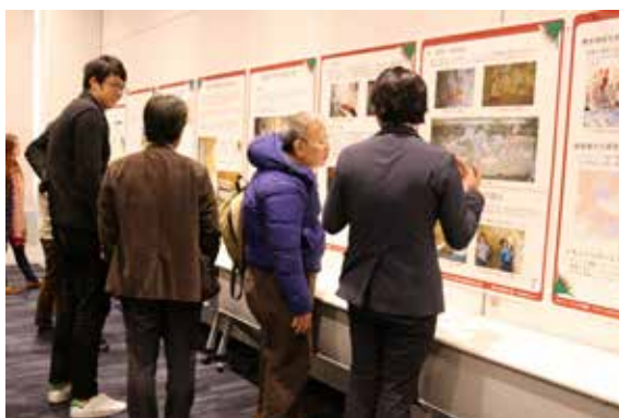
ポスターセッションの様子 Poster Report Session in the Conference