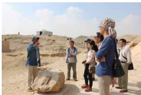
サッカラ遺跡へのエクスカーショ Excursion at Saqqara Archaeological Site