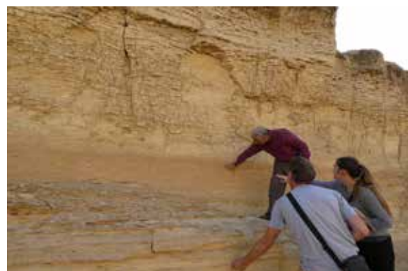
岩体強化実験箇所の選定 Selection of the Place of Experiment