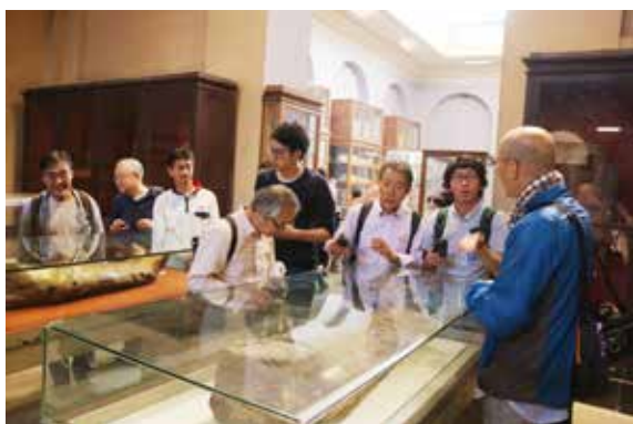
カイロ考古学博物館へのエクスカーショ Excursion in Egyptian Museum

archaeological sites in Saqqara, Dahshur and Giza. At Saqqara, members visited Mastaba Idout and had discussions for future activities. Also the members visited the site originating from the 26th dynasty where Egyptian archaeologists are currently excavating. In Giza, the members visited the site of the second solar boat project where the restoration works are being proceeded with the cooperation of a Japanese team. The members also had the opportunity to learn about the policy, contents, and future tasks of the restoration works from the Japanese experts who are engaged in the project.