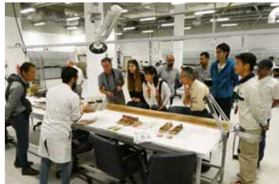
大エジプト博物館保存修復センターへのエクスカーション Excursion in GEM-CC