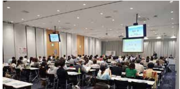
セミナーの様子 Lecture Session in the Seminar

ジプト学を学ぶ方々へのメッセージが述べられました。なお、本セミナーの講演内容をまとめた刊行物が2018年3月に発刊される予定です。