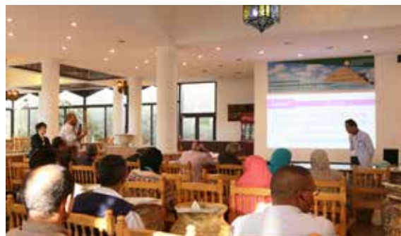
ディスカッションの様子 Discussion Session in the Meeting