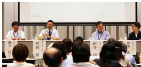
質問コーナーの様子 Question Corner in the Seminar