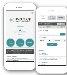
学生画面:スマートフォン版