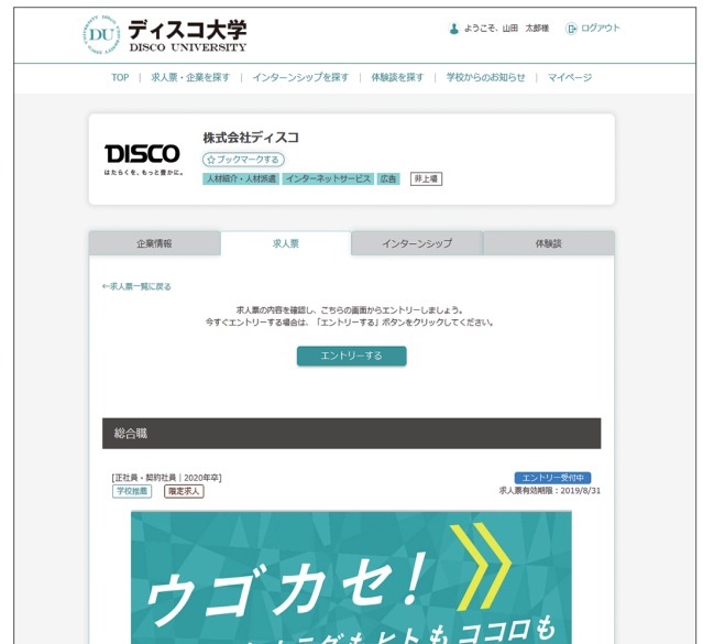
▲学生：求人票詳細画面

採用人数や募集期限など、こまめに情報を更新してください。鮮度の高い情報は、学生や学校からの信頼度が高く、応募者が増える要因にもなります。