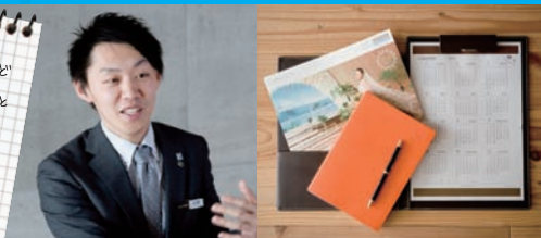
手帳、カレンダー、パンフレットは、打ち合わせには欠かせません。半年先、1年先の挙式の打ち合わせも多いので、カレンダーは2015年度版です。