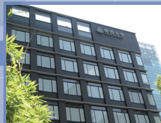
関西大学梅田キャンパス