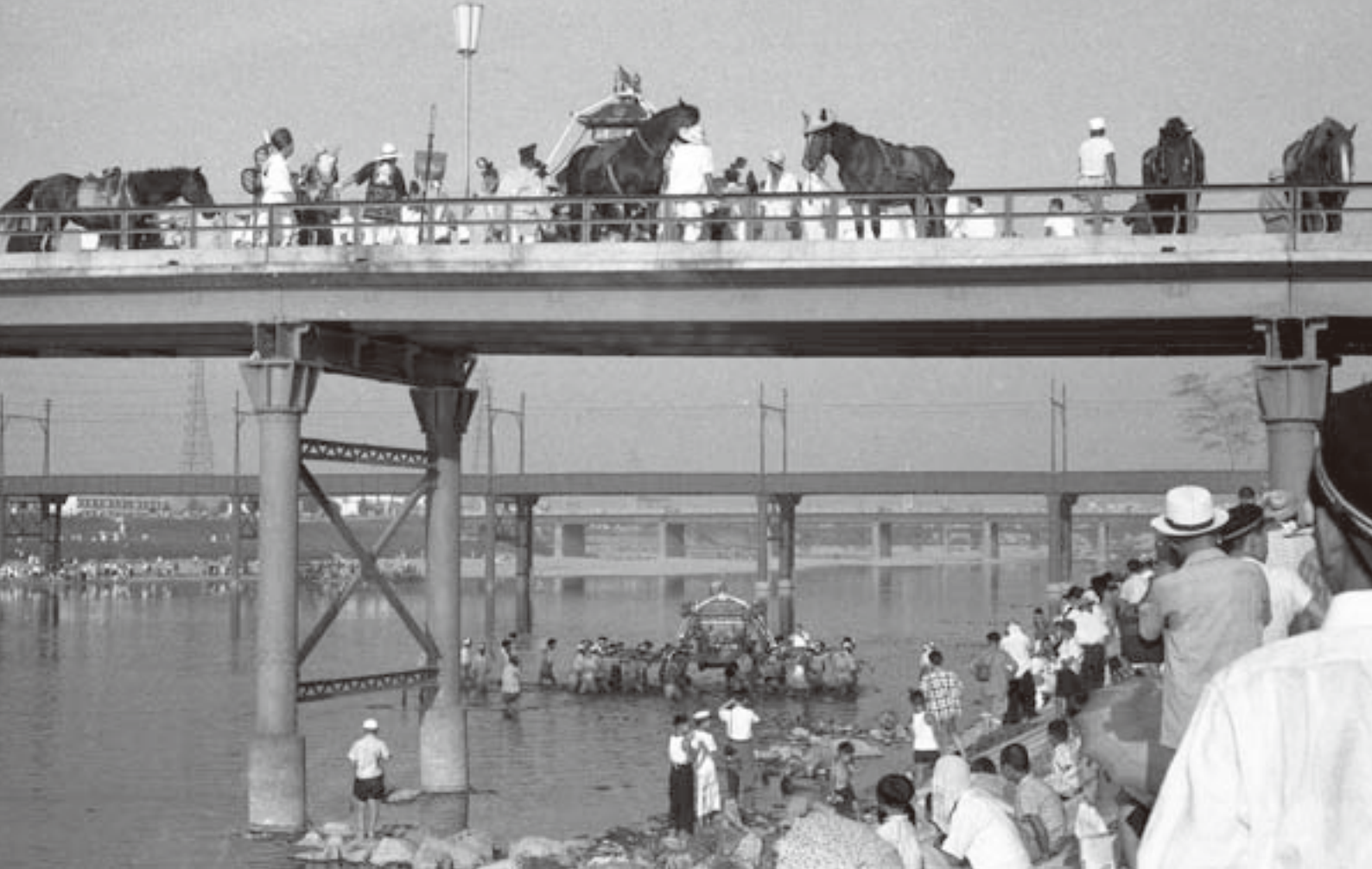
住吉祭・大和川を渡る神輿(1960年)