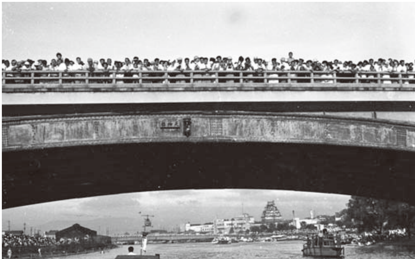
天神祭・船渡御（1954年）