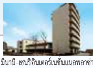
มินามิ-เซนริอินเตอร์เนชั่นแนลพลาซ่า