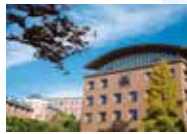
วิทยาเขตเซนริยามะ