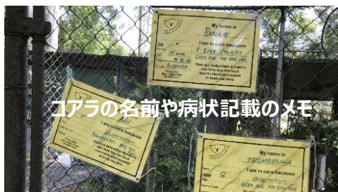
コアラの名前や病状記載のメモ