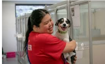
SPCA アニマルシェルター