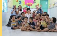
子どもデイケアセンター

慈善団体や、教会が主催するボランティア、フードバンク、アニマルシェルター、子どもデイケアセンター、日系アメリカ人団体のサポート、日本語学習者のチューターなど、幅広い分野のボランティアワークを経験できます。ボランティアコーディネーターとの面談で、英語力・希望・日本の大学での専攻などをベースに、どのようなボランティアワークを行うかを一緒に決めることができます。英語力は不問ですが、ワーク中は英語でのコミュニケーションが主となるため、実践的な英語力を向上させたい方にもお勧めです。