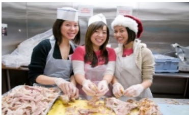
Glide Church 食事提供