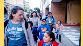
Glide Church 学童クラブ