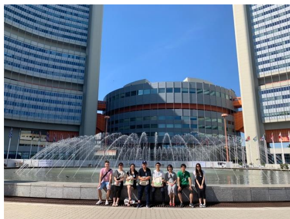
国連機構がある建物の中庭で