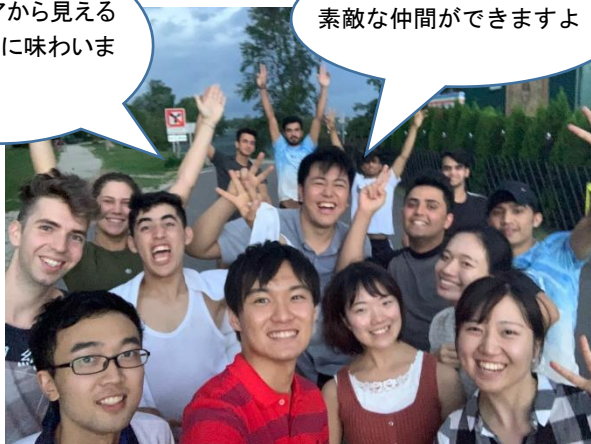
難民の青年達と2019年度派遣員