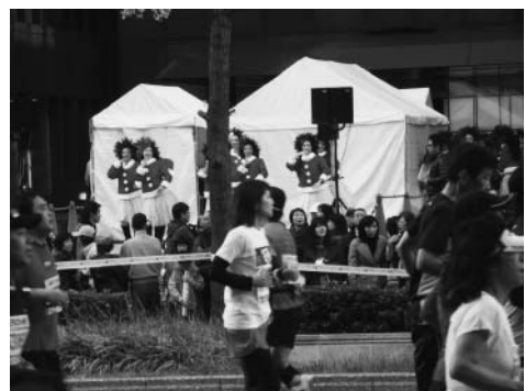
パフォーマンスで応援する「ランナー盛り上げ隊」