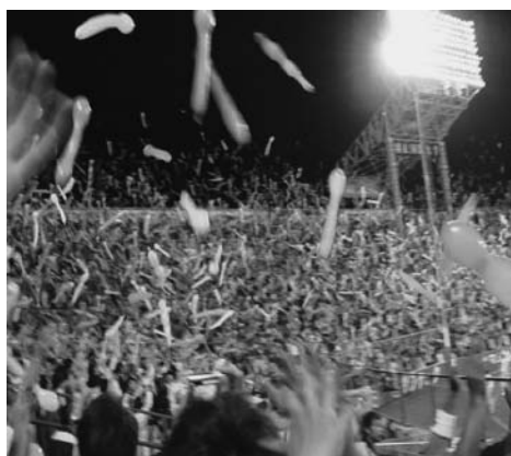
応援のパフォーマンスが観客を競技場へと誘う

2002年のサッカーワールドカップから日本では、みんなでテレビ画面を見て応援する「パブリックビューイング」が広がった。一般的には、テレビによるスポーツ観戦は一人あるいは数人で見て、競技の展開を楽しむものであった。あるいは、そのスポーツに興味はあるが、競技場に行けない人のための補助的なものであった。ところが、応援のパフォーマンスを楽しもうとする人は、そのスポーツに興味があるなしに関わらず、競技場へと足を運ぶ。この楽しみ方を手に入れた観客は、みんなでパフォーマンスが