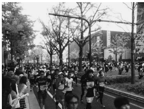
御堂筋を北向きに走る

この写真は、日常では走ることができない御堂筋を走っている。しかも、御堂筋は南行き一方通行なのに北に向かって走っている。日常では車で走っていても、こういう角度から景色を見ることはできない。それは走る人だけに与えられた特権であり、非日常性を象徴するような現象である。さらにそこには、スポーツの原点である遊び的要素が含まれているのである。