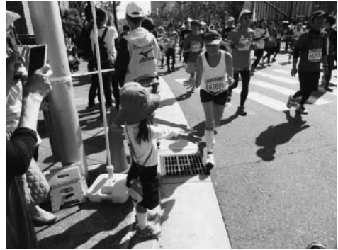
子どものハイタッチに元気をもらう

2015年10月25日に第5回大阪マラソンが開催される。ぜひ、沿道で応援してもらい、この感動を一緒に味わい、なぜ、感動するのかを議論できればうれしいと思う。