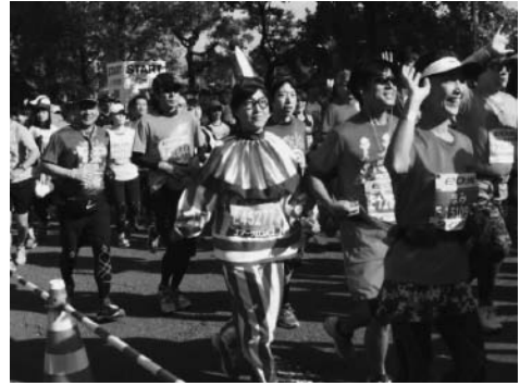
「くだおれ太郎」の仮装で走る

大阪マラソンと言えば「くだおれ太郎」の仮装をして走っている人が必ずいる。この仮装という行為は、R.カイヨワ（『遊びと人間』多田道太郎・塚崎幹夫訳、講談社学術文庫、1990年）がいう「ミミクリー」と呼ばれる模倣遊びである。