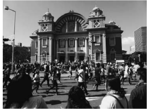
名所「大阪市中央公会堂」を観ながら走る

大阪マラソンでは、地下鉄東西線や御堂筋線を乗り継いでいくと、ランナーを追いかけることができる。そのパターンは、大阪城のスタート地点で応援し、中之島の大阪市中央公会堂で応援して難波に行く。そして、最後はインテックス大阪に行きゴールを待つというルートである。ちなみに、コースは大阪城公園から難波に来て、御堂筋を北に上がって中央公会堂を回って南下して難波に戻り、今度は京セラドームに行き、また難波に戻ってインテックス大阪に向くと、難波はランナーが3回通ることになっ