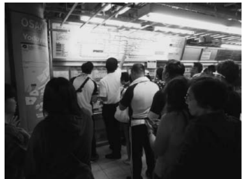
地下鉄で移動する観客