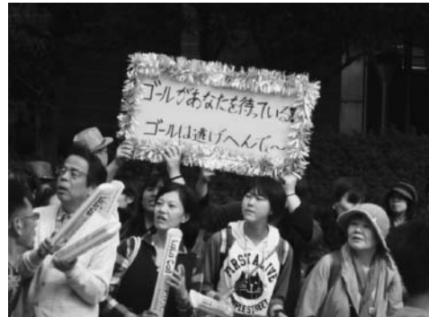
ユーモアあふれる応援メッセージ

この写真は、子どもが手を出してハイタッチを求めている。この子とハイタッチをしたくて多くのランナーが寄って来る。そして、ハイタッチをして笑顔になって元気に走り出す。また、大阪マラソンでは知らない人から声を掛けられる。それも、辛辣ではあるが心温まる声掛けである。今は「知らない人から声を掛けられたら逃げなさい」と子どもたちに教える時代だから、こんなことは日常生活では起きない。このように、都市生活では稀有な体験が都市生活の孤立感から救ってくれる。そして、それを体験した人が、日常生活でも近所の人に気楽に声をかけられるようになったという事例が語るように、われわれの日常の都市生活を活性化する。