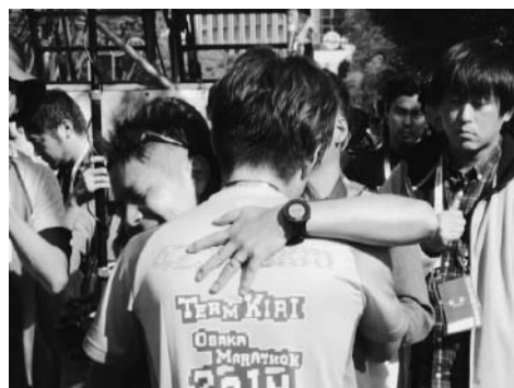
ランナー同士の一体感

この写真はゴールした時、仲間と抱き合っ 喜ぶ感動的なシーンである。こういうふう にランナー同士の一体感、あるいはラン ナーと観客との一体感、さらにラン ナーとボランティア・スタッフとの一 体感が得られるのが、大阪マラソン への大きな誘因となっている。第4回 大阪マラソンのランナー調査によると、 「走る仲間と一体感を感じることが できる」という人が85.9%