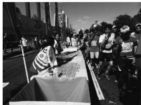
「まいどエイド」の給食で癒やされる