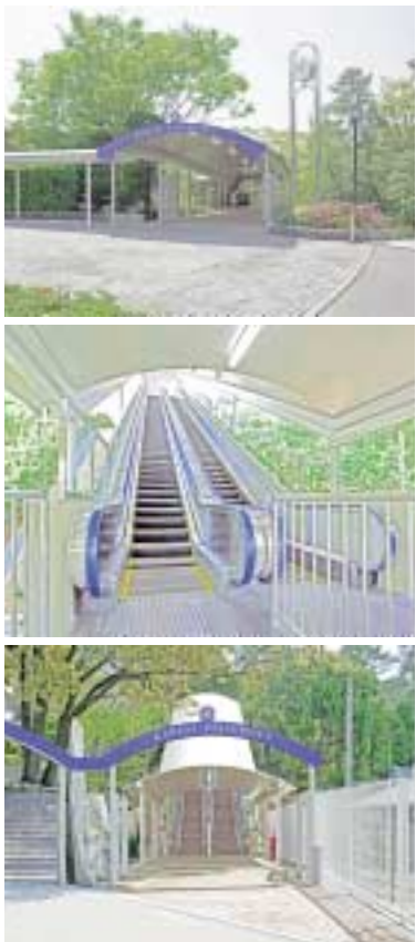
(阪急電鉄「関大前駅」南出口からエスカレーター設置)

消費収入は、学生生徒等納付金、手数料、補助金などの法人に帰属する収入と、四百三十六億九千九百九十九万九千九百九十九円となり、対前年度比較で十七億二千九百九十九万九千九百九十九円増となりました。基本金組入額は、施設設備費の増減を調整した上で、前年度より十七億二千九百九十九万九千九百九十九円増となりました。消費支出は、前年度より十七億二千九百九十九万九千九百九十九円増となりました。消費収支差額は、前年度より十七億二千九百九十九万九千九百九十九円増となりました。