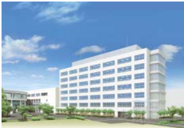
第2学舎2号館竣工イメージ図

この実現のため、私立大学を取り巻く今日の状況や本学財政の現状と将来予測を踏まえつつ、支出内容を厳しく見直し、合理性・効率性を求める一方、緊急性・重要性・発展性のある計画に対しては積極的な予算配分を行い、特に短期一年・平成二十一年度の計画であっても、昨今の厳しい状況変化に速やかに対応して計画を見直し、予算措置を踏まえて行動するという考え方に立脚して本予算を編成いたしました。