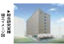
▲総合研究室棟竣工イメージ図