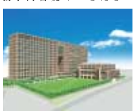
▲高槻新キャンパス竣工イメージ図

平成二十年の事業計画は、次の2事業計画の概要のとおりですが、厳しき財政状況について本学関係者の理解と協力を得て、今後とも厳正で効果的な予算執行を行い、財政の健全化と財政基盤の強化に向けてさらに努力する所存です。