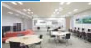
東京センター（赤枠部分）

資金収入は、学生生徒等納付金収入、手数料収入、補助金収入などの法人に帰属する収入のほか、借入金収入、前受金収入なども含め、四百六十五億八千五百円となりました。この結果、差し引き年度不足資金支出は、教職員の人件費、教育研究活動および法人の運営に必要な諸経費、施設設備費のほか、借入金返済などの支出も含め、四百八十九億八千九百五十九円となりました。この結果、差し引き年度不足資金支出は、教職員の人件費、教育研究活動および法人の運営に必要な諸経費、施設設備費のほか、借入金返済などの支出も含め、四百八十九億八千九百五十九円となりました。