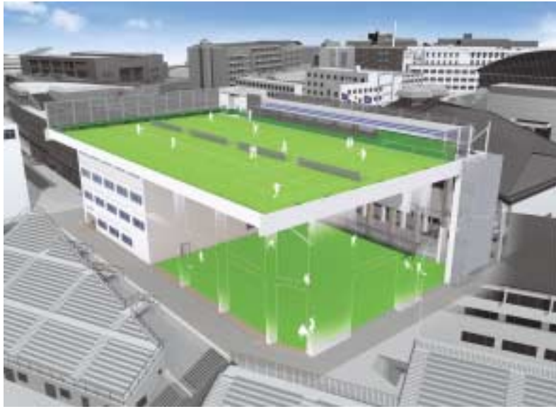
第四学舎三号館と宇野二ニスコート、屋内練習場(平成二十年三月竣工予定)