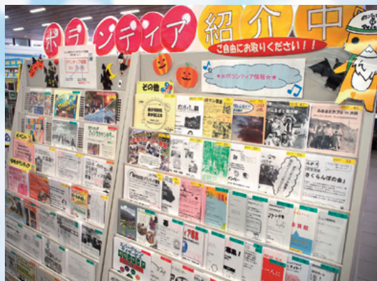
↑10月はハロウィン使用の装飾を行いました