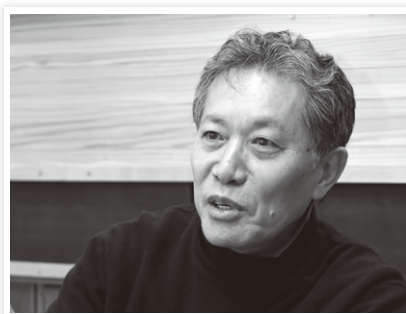
内田 樹氏 [ 神戸女学院大学 名誉教授 ]

本シンポジウムでは、贈与経済について基調講演を行う。内田氏は贈与経済について、社会的成熟に達していない人間は「商品を買う」ことはできるが、「贈与する」ことはできない。贈与は人間的成熟を要求する。私たちの社会システムは「適切に贈与を果たしうような成熟した市民の育成」を目標として制度設計のやり直しをしなければならないと主張されている。