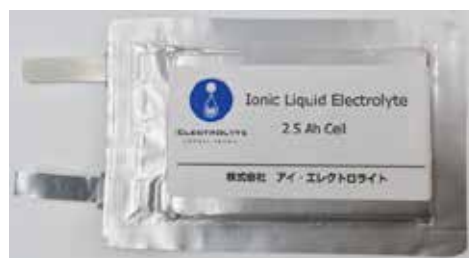
世界最小人工衛星打上げJAXAロケット「SS-520」5号機に採用されたイオン液体電池

イオン液体のリチウムイオン電池の宇宙運用は、まず2014年6月打ち上げの人工衛星「ほどよし3号」で試験運用。2018年2月JAXA「SS-520」5号機の制御電源として採用され、宇宙空間到達に電源として貢献。