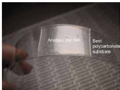
湾曲したポリカーボネートの表面に作製した酸化チタン薄膜