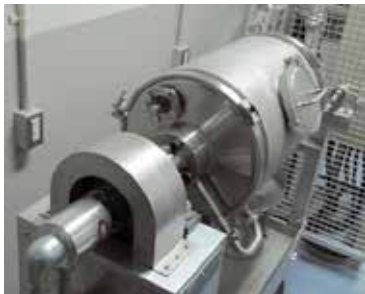
ドラム式反応槽(容量50L)

現在、パイロットスケールの試験データから、エネルギー収支と処理コストのシミュレーターを構築中。サンプルをご用意頂ければ、試験結果と収支見込みのデータを提供致します。