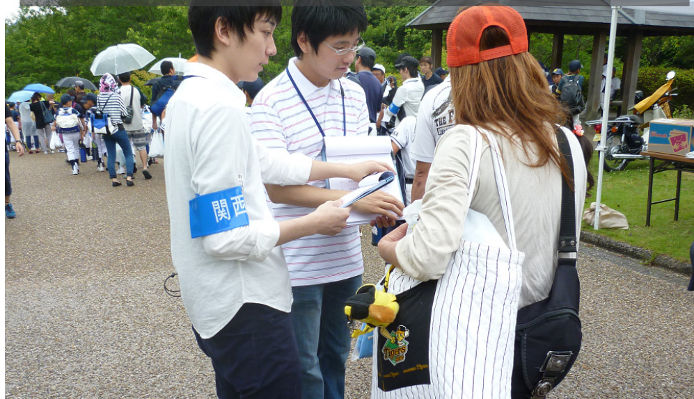
球場で調査を行う学生

前ページに掲載したオリックス・バファローズ観客動向調査の2014年度における活動の事例です。総合情報学部と商学部の学生が専門性を活かした調査・分析および提案を行いました。