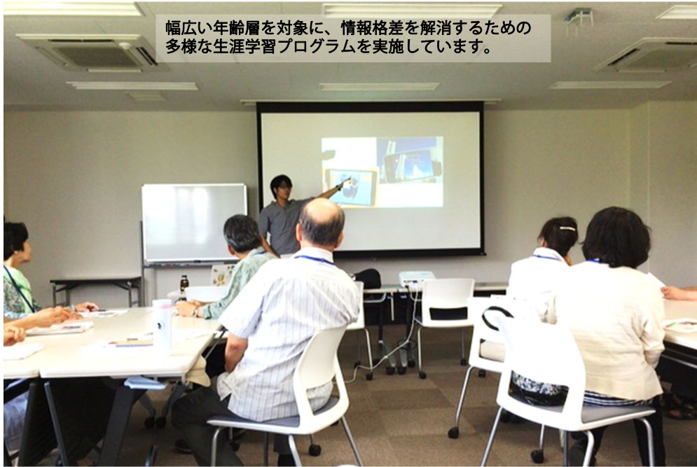
大学キャンパスに招いて行った講座最終日の授業風景

幅広い年齢層を対象に、情報格差を解消するための多様な生涯学習プログラムを実施しています。