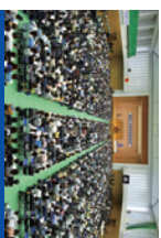
総会会場内の様子

毎年5,000人を超える父母・保護者の皆様にお越しいただいております。総会終了後には、お礼団による演舞も予定しています。