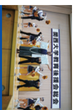
総会終了後の応援団による演舞

毎年5,000人を超える父母・保護者の皆様にお越しいただいております。総会終了後には、お礼団による演舞も予定しています。