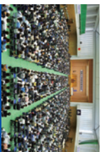
総会会場内の様子

毎年5,000人を超える父母・保護者の皆様にお越しいただいております。総会終了後には、お集団による帰路も予定しています。