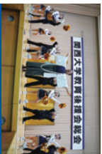
総会終了後の応援団による演奏

毎年5,000人を超える父母・保護者の皆様にお越しいただいております。総会終了後には、お集団による帰路も予定しています。