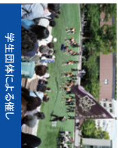
学生団体による催し

新関西大学会館、総合学生会館、メディアパーク、凜風館などさまざまな相談コーナーを設けます。詳細は6頁をご覧ください。種別別来学や学生団体による催し、関大メッセの販売などを予定しています。詳細は当日配布の「総合資料」でご案内させていただきます。