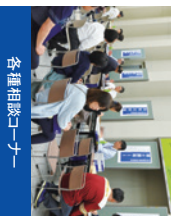
各種相談コーナー