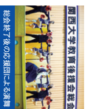
総会終了後の応援団による演舞

毎年5,000人を超える父母・保護者の皆様にお越しいただいております。総会終了後には、応援団による演舞も予定しています。