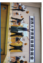
総会終了後の応援団による演舞

毎年5,000人を超える父母・保護者の皆様にお越しいただいております。総会終了後には、お集団による帰路も予定しています。