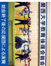
総会終了後の応援団による演奏

毎年5,000人を超える父母・保護者の皆様にお越しいただいております。総会終了後には、応援団による演奏も予定しています。