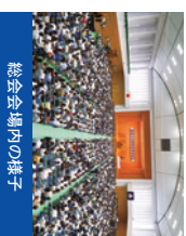
総会会場内の様子

毎年5,000人を超える父母・保護者の皆様にお越しいただいております。総会終了後には、応援団による演奏も予定しています。