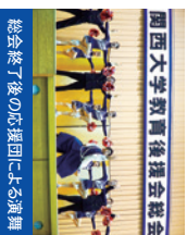
総会終了後の応援団による演奏

毎年5,000人を超える父母・保護者の皆様にお越しいただいております。総会終了後には、応援団による演奏も予定しています。