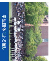
学生団体による催し

新関西大学会館、総合学生会館メデアパーク 凜風館などにさまざまな相談コーナーを設けます。詳細は5ページをご覧ください。博物館見学会や学生団体による催しなどを予定しています。詳細は当日配付の「総会資料」でご案内させていただきます。