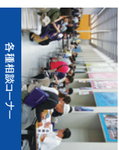
各種相談コーナー