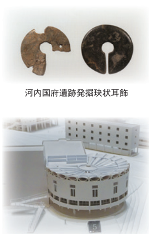
河内国府遺跡発掘帛状耳飾

・関西大学に現存する最古の建物「簡文館」の2階にある博物館では、春季企画展「河内国府遺跡発掘 100 周年—近畿地方考古学のはじまり—」と、テーマ展「関西大学と村野藤吾」を同時開催しています。特別展示室では、河内国府遺跡から発掘された当館収蔵の資料を核として、京都大学や大阪府教育委員会などから関連資料を集めて企画展示を開催します。常設展示室では、1969 年頃の「関西大学千里山キャンパス」建築模型を展示します。併せてご覧ください。