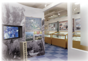
千里山キャンパス 簡文館 (模型一部)

企画展示室では、今春創設 50 周年を迎えた社会学部の歴史を写真パネルやゆかりの品々で振り返る「人と社会をみつめて—関西大学社会学部 50 年のあゆみ」展を開催しています。