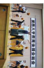
総会終了後の応援団による演舞

毎年5,000人を超える父母・保護者の皆様にお越しいただいております。総会終了後には、お礼団による演舞も予定しています。