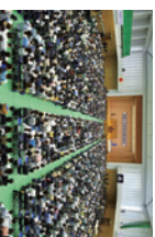
総会会場内の様子

毎年5,000人を超える父母・保護者の皆様にお越しいただいております。総会終了後には、お礼団による演舞も予定しています。