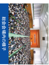
総会会場内の様子

毎年5,000人を超える父母・保護者の皆様にお越しいただいております。総会終了後には、応援団による演奏も予定しています。