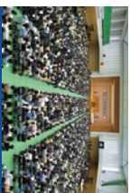
総会会場内の様子

毎年5,000人を超える父母・保護者の皆様にお越しいただいております。総会終了後には、お集団による帰路も予定しています。