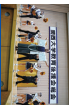
総会終了後の応援団による演奏

毎年5,000人を超える父母・保護者の皆様にお越しいただいております。総会終了後には、お集団による帰路も予定しています。