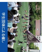
学生団体による催し

新関西大学会館、総合学生会館、メデアパーク 凜風館などさまざまな相談コーナーを設けます。詳細は5頁をご覧ください。種別別来学や学生団体による催し、関大メッセの順券などをご予定しています。詳細は当日配布の「総合資料」でご案内させていただきます。