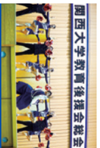
関西大学教育後援会総会 総会終了後の応援団による演舞

毎年5,000人を超える父母・保護者の皆様にお越しいただいております。総会終了後には、応援団による演舞も予定しています。