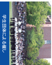
学生団体による催し

新関西大学会館、総合学生会館メディアパーク 凜風館などにさまざまな相談コーナーを設けます。詳細は5ページをご覧ください。博物館見学会や学生団体による催しなどを予定しています。詳細は当日配付の「総会資料」でご案内させていただきます。