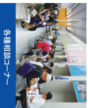
各種相談コーナー