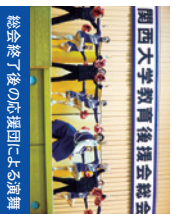
総会終了後の応援団による演奏

毎年5,000人を超える父母・保護者の皆様にお越しいただいております。総会終了後には、応援団による演奏も予定しています。