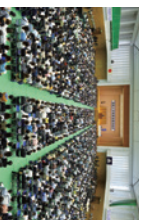
総会会場内の様子

毎年5,000人を超える父母・保護者の皆様にお越しいただいております。総会終了後には、応援団による演舞も予定しています。