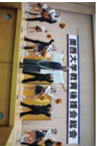
総会終了後の応援団による演舞

毎年5,000人を超える父母・保護者の皆様にお越しいただいております。総会終了後には、応援団による演舞も予定しています。