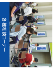
各種相談コーナー