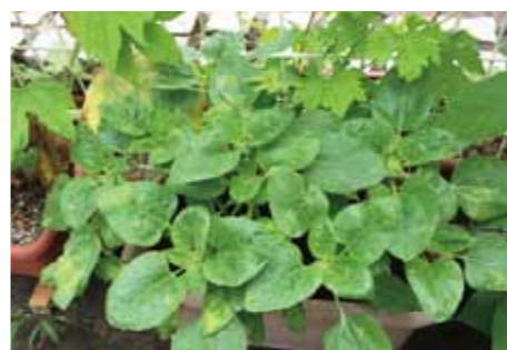
だんだんテラスに、ご好意で植えて下さった向日葵。花が咲くのが楽しみです。

「おはようございます」の挨拶で始まるだんだんテラス。毎朝の皆さんの笑顔が素晴らしいです。今は、ラジオ体操のみの参加ですが、色んな教室もあり、また皆さんのお話も出来、一日楽しく過ごせます。 この前は、マスコミ等にも取り上げられ、TVにて放映された学生さん達の試行錯誤の成果を気軽に見に来て頂いて、お仲間が少しでも増えていくことを願っています。