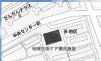
京阪バス「中央センター前」下車 UR 男山団地の敷地内に建設中。

だんだんテラスにこられる住民の方から最近よく「あそこには何ができるの？」と尋ねられます。大きな建物が中央センター前、B地区に現れました。そんな住民の方々の疑問にお答えすべく、だんだん通信8月号に掲載します！あそこは地元の社会福祉法人である社会福祉法人若竹福祉会（文中敬称略）が建設、運営します。完成は秋頃を予定しています！今後の進展もこのだんだん通信を通して報告して行く予定です！