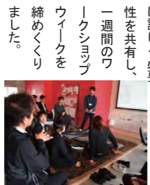
●「だんだんテラスに期待する事」をテーマに様々な意見が出された。

団地にお住まいの方からは、住環境に対する意見が多く寄せられました。自分たちの住まいは自分たちでつくる。近年、DIY (Do It Yourself) の考え方が注目されています。だんだんテラスでは今後DIYをテーマとした活動に取り組んでいきます。