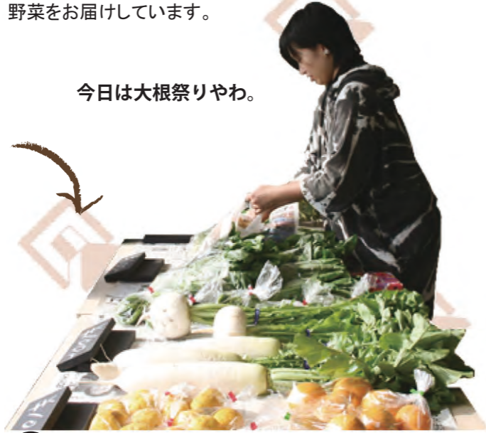
今日は大根祭りやわ。

だんだん朝市には近所の農家さん8人にご協力頂いています。学生は野菜を各家の軒先まで取りに行きます。週3回新鮮で心のこもった野菜をお届けしています。