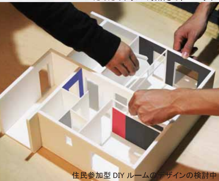
住民参加型DIYルームのデザインの検討中