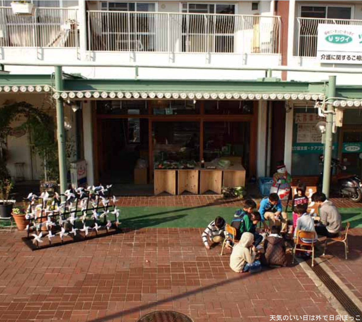
天気の良い日は外で日向ぼっこ