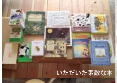
いただいた素敵な本

関西大学団地再編プロジェクトでは、団地の再生・更新をテーマに海外・国内団地の研究を行ってきました。集合住宅団地は少子高齢化コミュニティの弱体化、住宅の老朽化、設備の陳腐化などの社会問題を抱えています。物理的な「空間」だけでなく、市や行政・企業と協力する仕組みを作る「公共政策・マネジメント」、地域ごとに違うあり方をする「コミュニティ」も同時に考えていこうとしています。その過程で、住民の方の意見は貴重なものとなります。 現在は DM 住宅の普及活動の進め方・提案、子育て支援施設、子育て住戸の計画が進行中です。体験談や日常の困ったこと等あれば是非だんだんテラスでお聞かせください。 団地のミライを一緒に考えましょう。