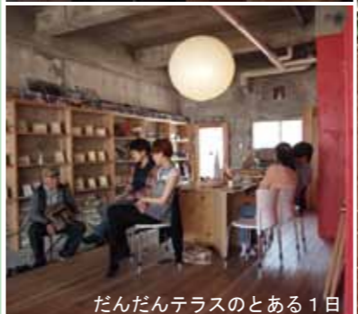
だんだんテラスのとある1日